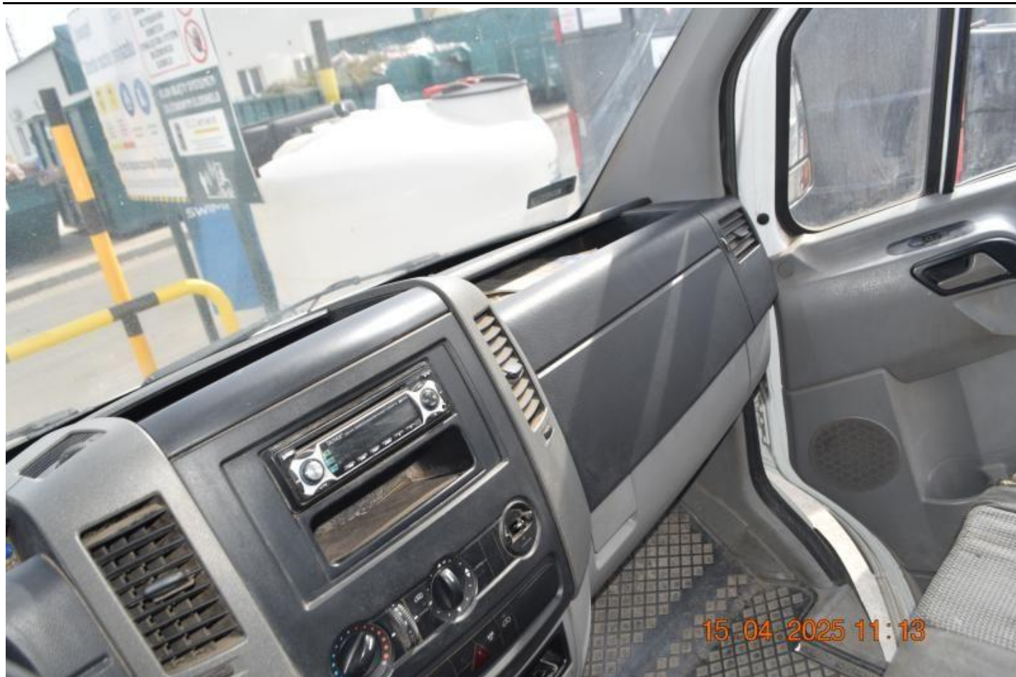
Fot. nr 67