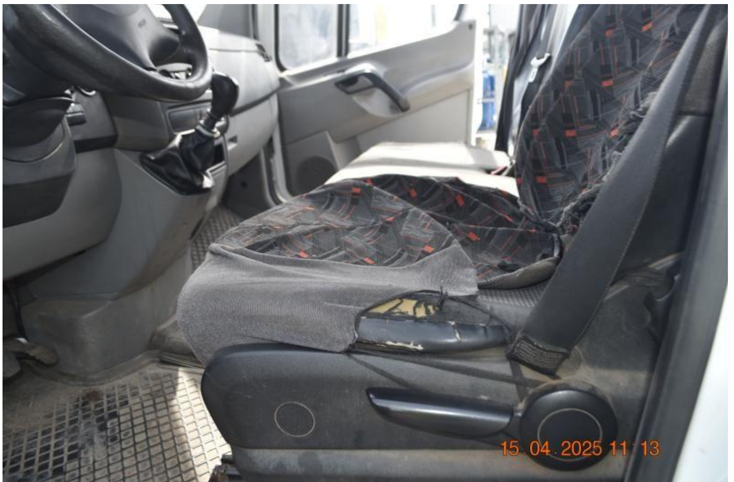
Fot. nr 64