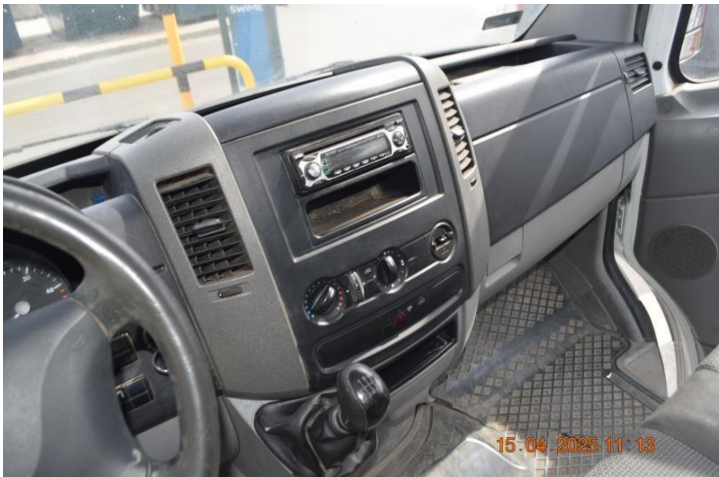
Fot. nr 66