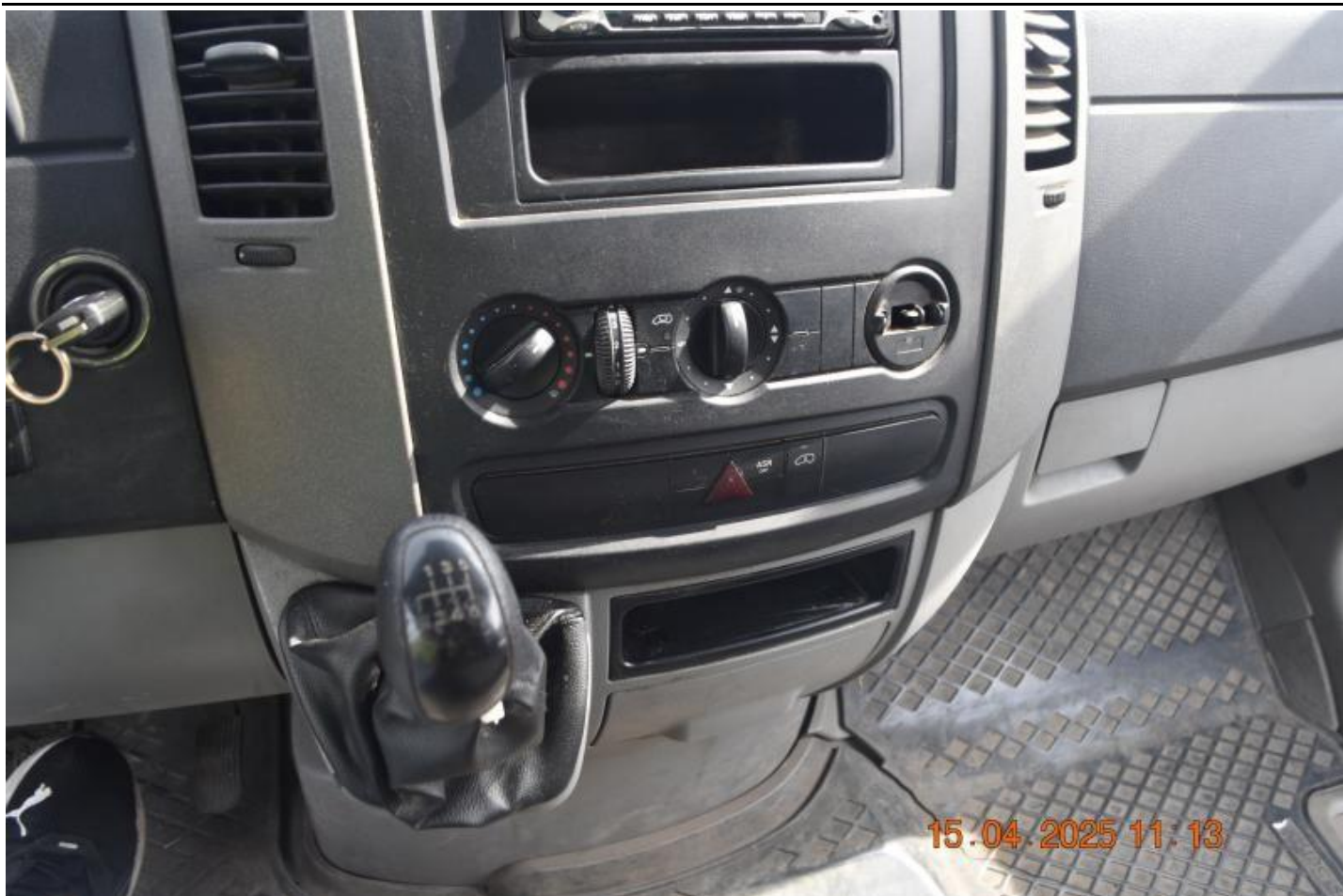
Fot. nr 69