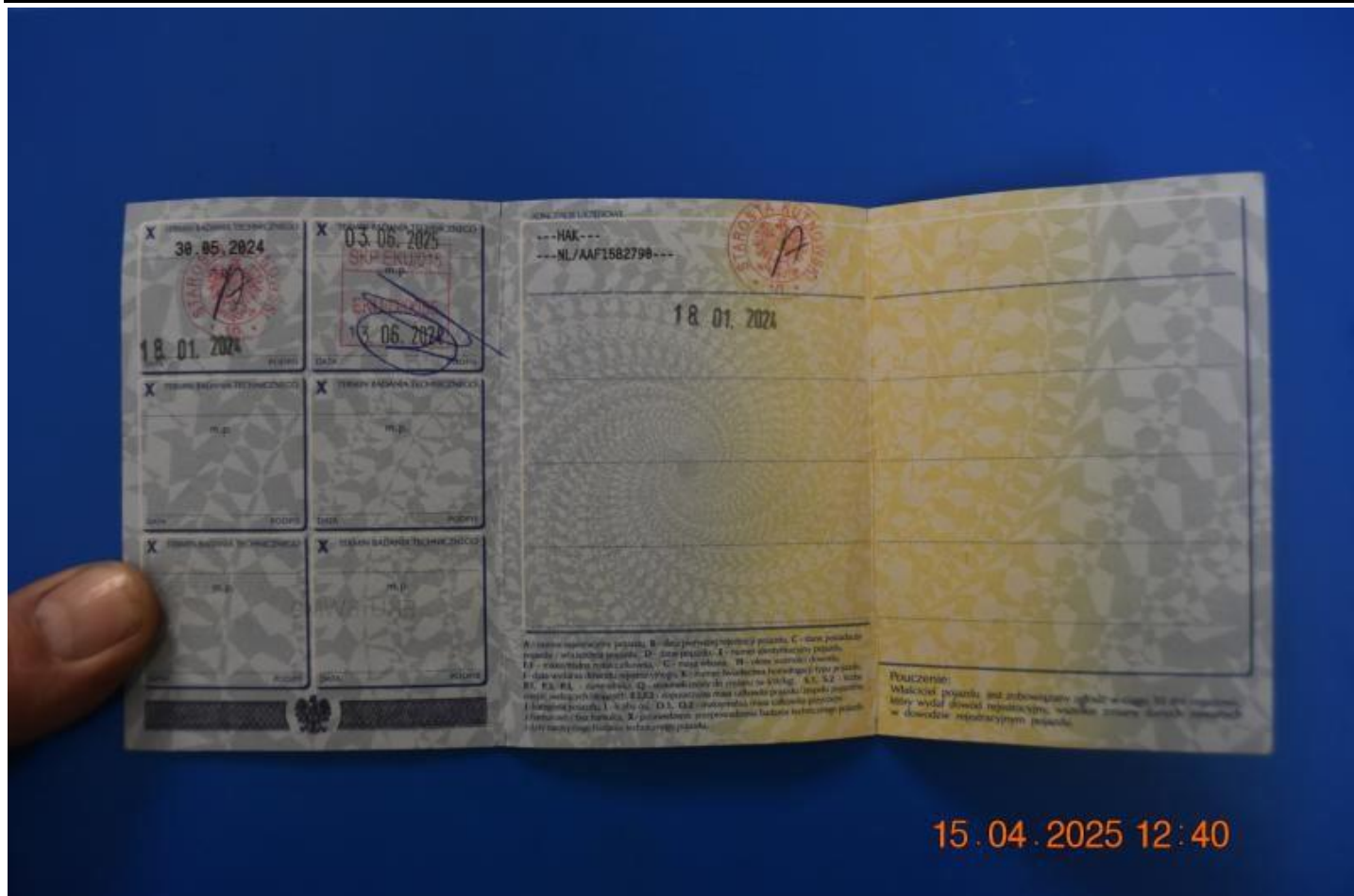
Fot. nr 71

Dokument wystawiony elektronicznie, wa ny bez podpisu