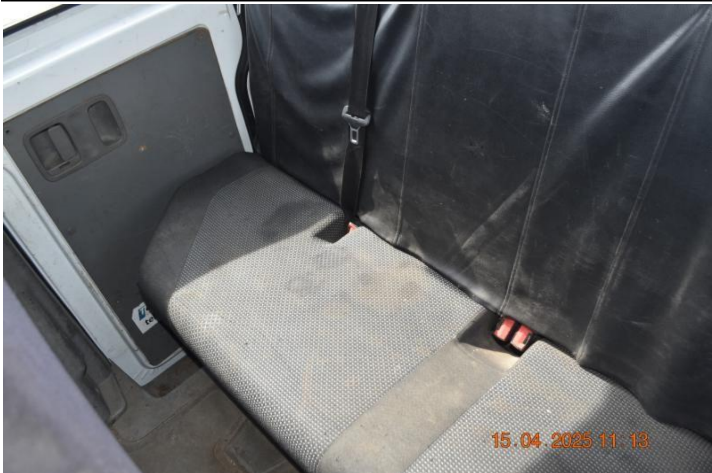
Fot. nr 65