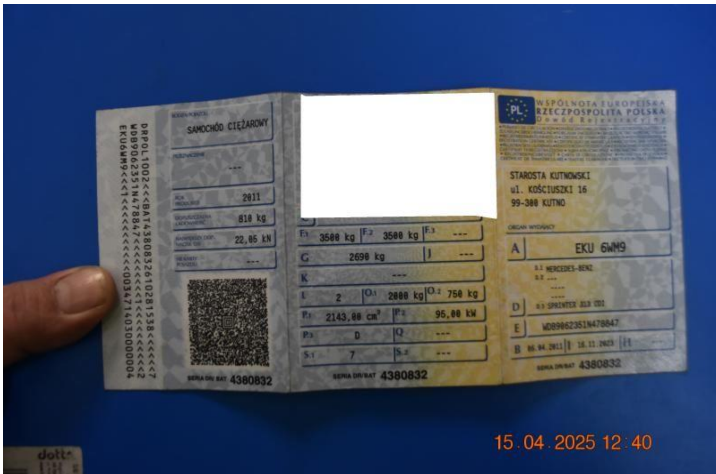
Fot. nr 70