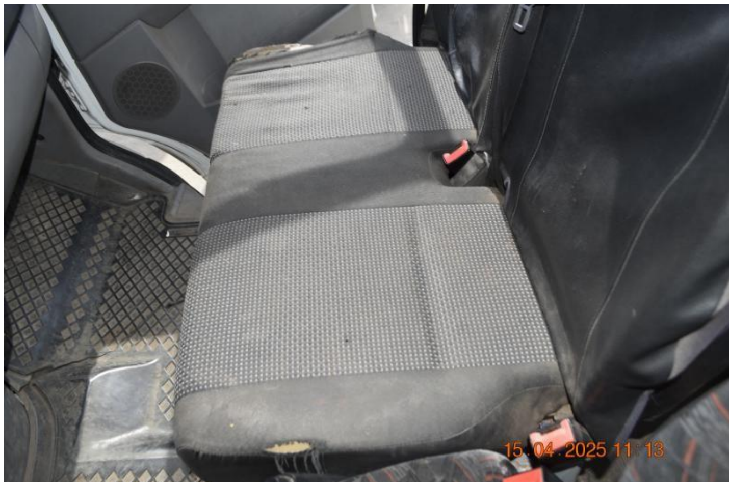
Fot. nr 68