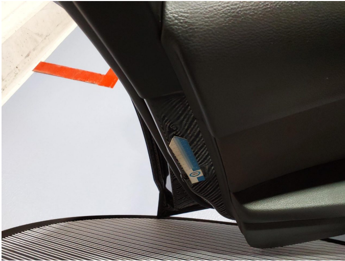
Gebrauchsspur 3: Tür vorn links: Tür - Delle(n) - kein Abzug