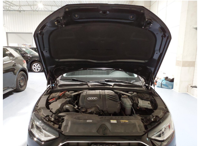
Abbildung 8: Innenraum