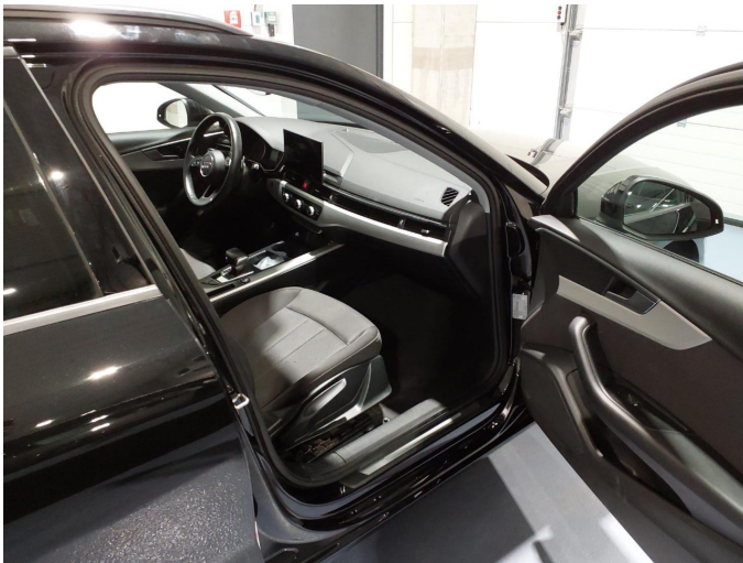
Abbildung 9: Innenraum