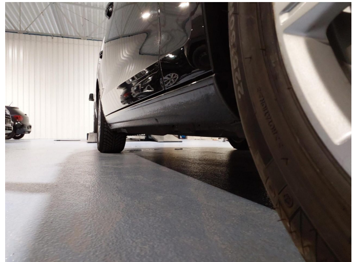
Abbildung 16: Schweller