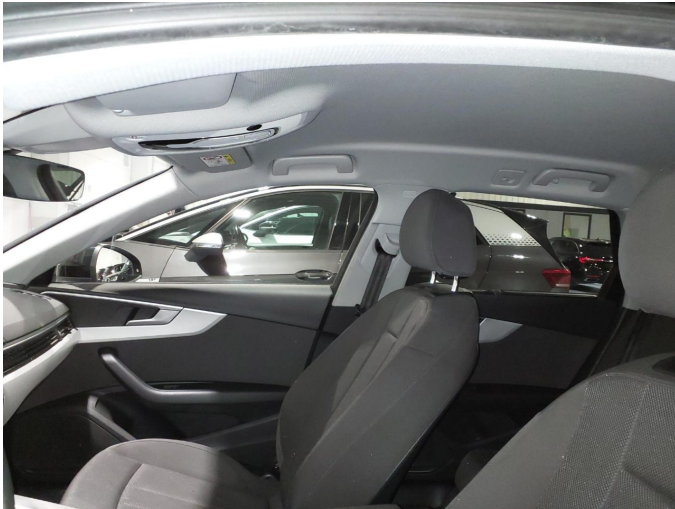
Abbildung 7: Innenraum