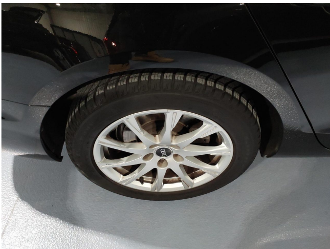
Abbildung 21: Räder/Reifen