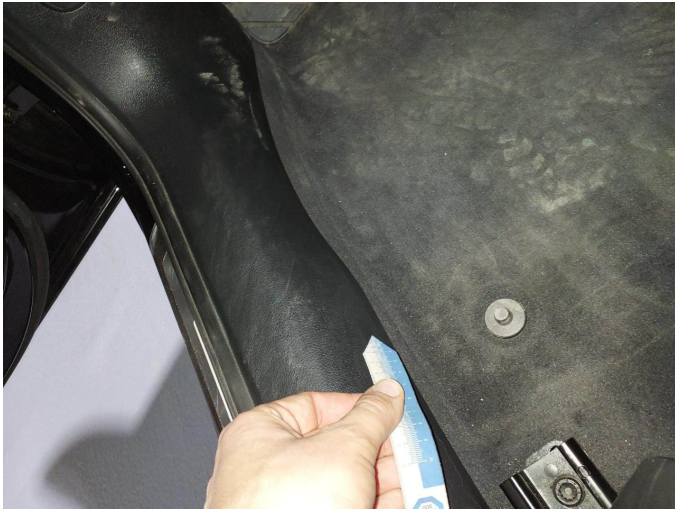
Beschädigung 1: Verkleidungen/Abdeckungen: Einstieg vorn links - verformt - erneuern