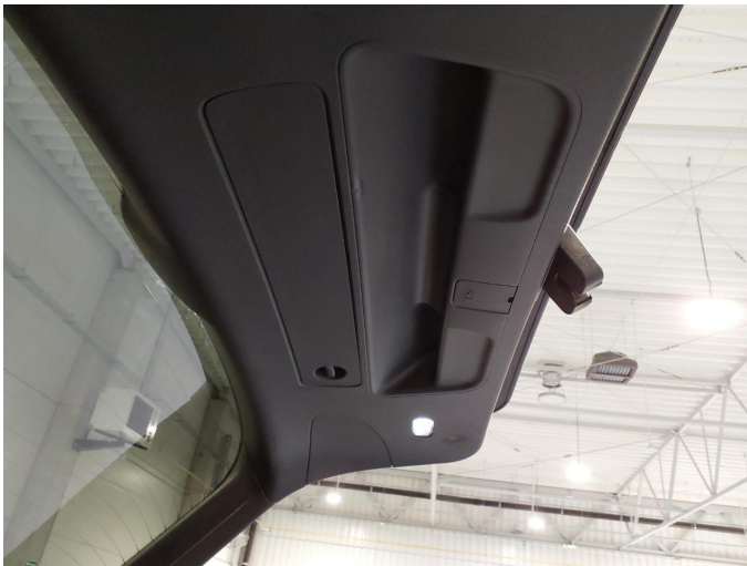
Gebrauchsspur 4: Verkleidungen/Abdeckungen: Heckdeckel, Innenverkleidung - verkratzt / verschürft - kein Abzug