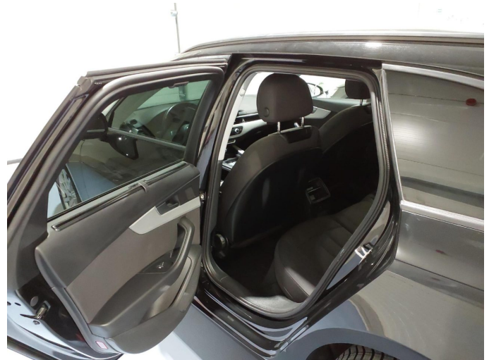
Abbildung 14: Innenraum