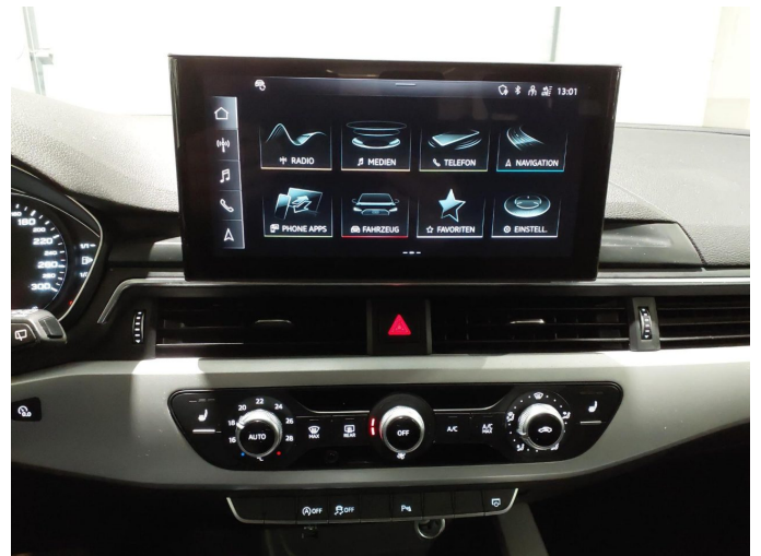
Abbildung 12: Innenraum