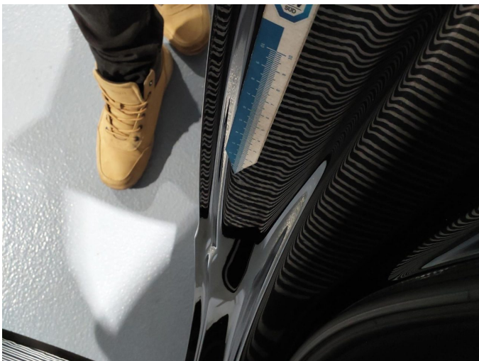
Gebrauchsspur 6: Seitenwand rechts: Seitenwand - Delle(n) - kein Abzug