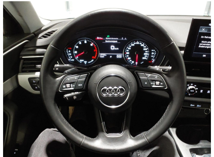
Abbildung 10: Innenraum