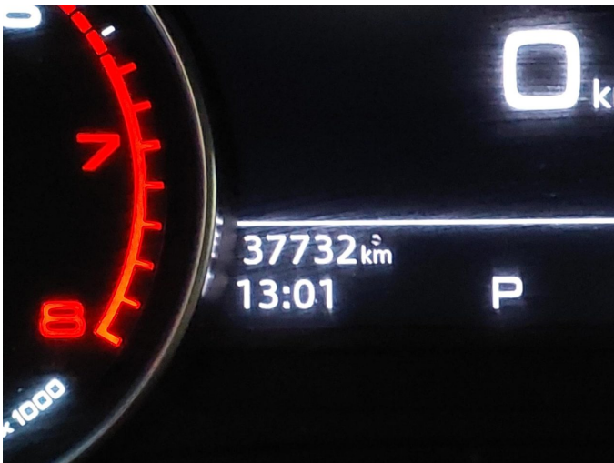
Abbildung 11: Innenraum