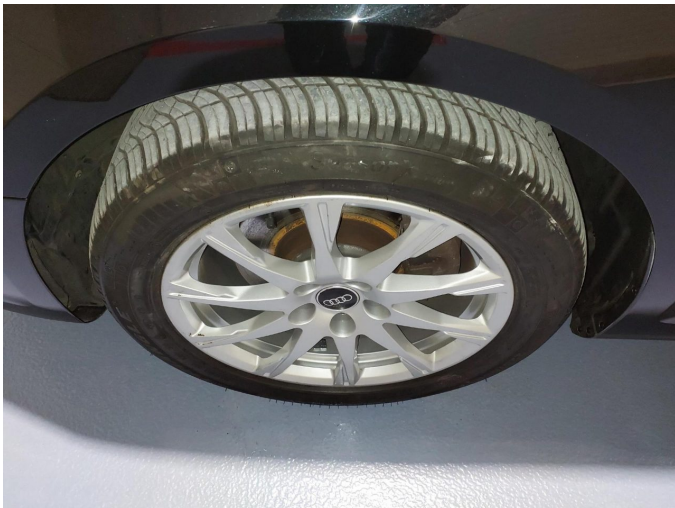
Abbildung 19: Räder/Reifen