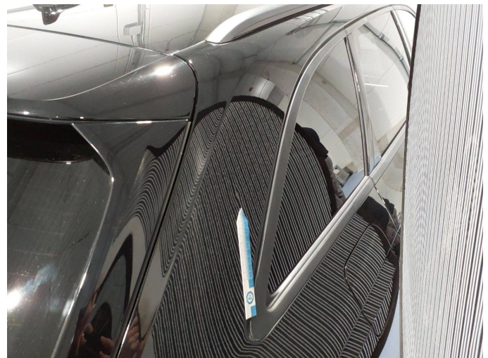
Gebrauchsspur 2: Seitenwand rechts: Seitenwand - Delle(n) - kein Abzug