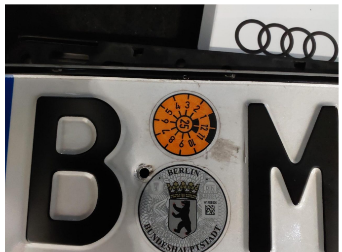
Abbildung 24: Fahrzeugdokumente