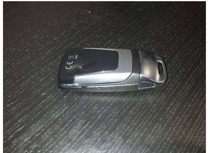
Beschädigung 3: Ausrüstung: Fahrzeugschlüssel m. Fernb. - beschädigt - erneuern