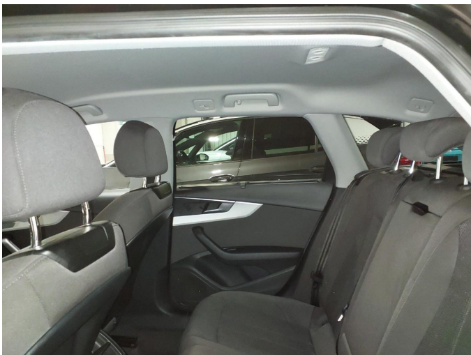
Abbildung 5: Innenraum