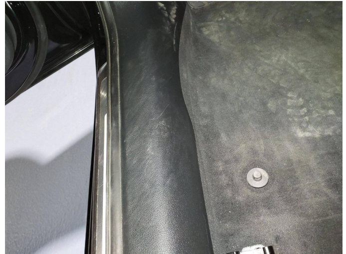
Beschädigung 1: Verkleidungen/Abdeckungen: Einstieg vorn links - verformt - erneuern