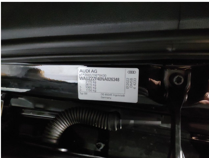
Abbildung 17: Typschild