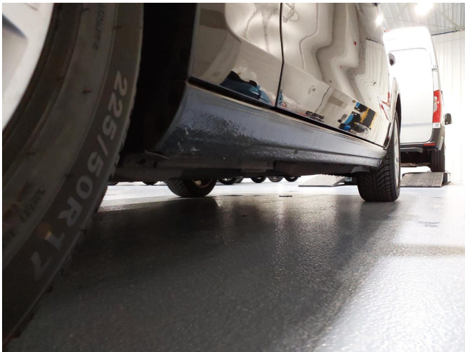
Abbildung 15: Schweller