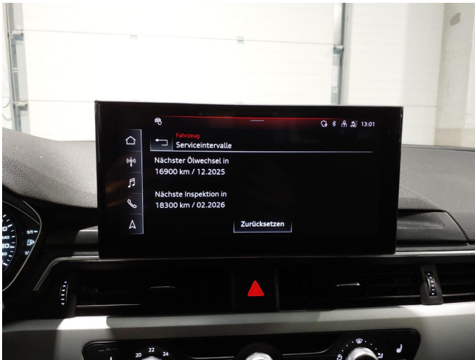
Abbildung 13: Innenraum