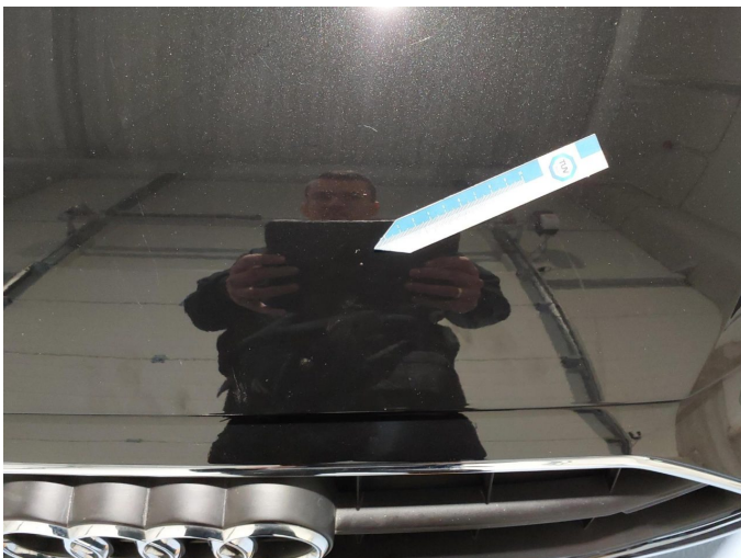
Gebrauchsspur 1: Motorhaube: Motorhaube - Steinschlag - kein Abzug