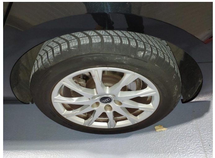
Abbildung 18: Räder/Reifen