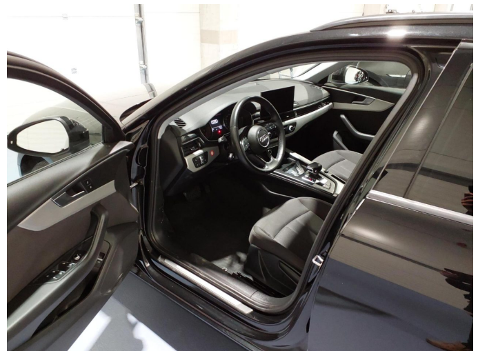
Abbildung 6: Innenraum