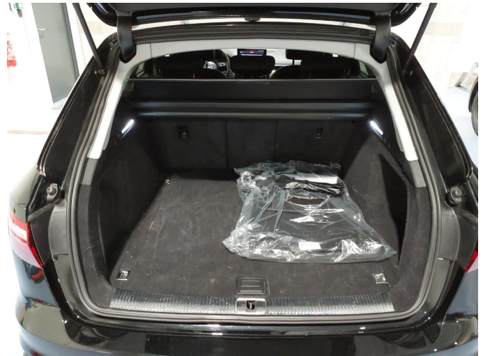
Abbildung 4: Innenraum