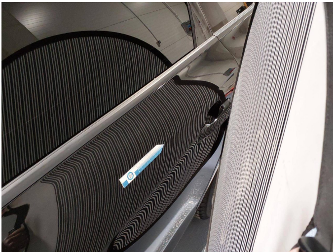
Beschädigung 2: Tür hinten links: Tür - Delle(n) - sanft instandsetzen