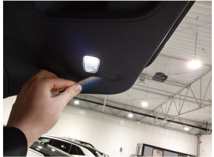
Gebrauchsspur 4: Verkleidungen/Abdeckungen: Heckdeckel, Innenverkleidung - verkratzt / verschürft - kein Abzug