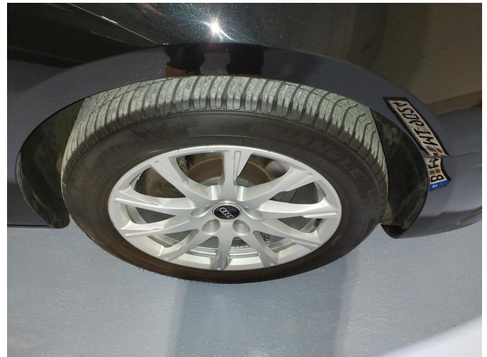
Abbildung 20: Räder/Reifen