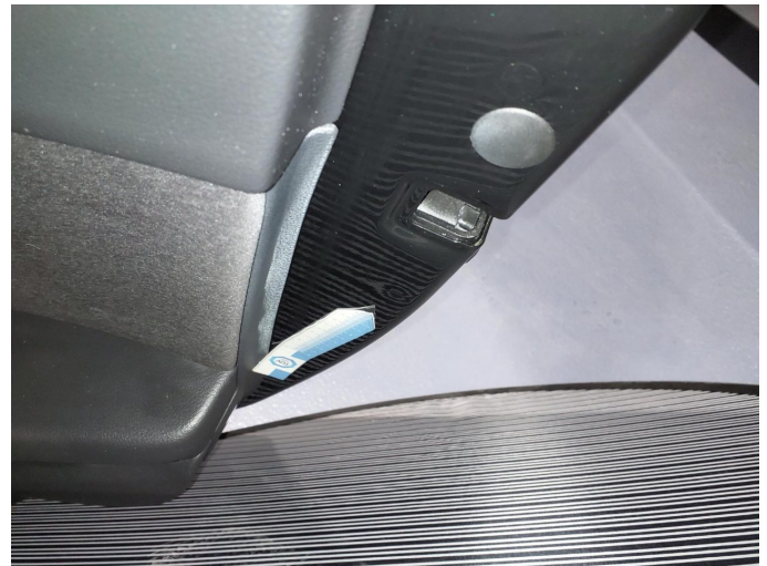
Gebrauchsspur 5: Tür hinten rechts: Tür - Delle(n) - kein Abzug